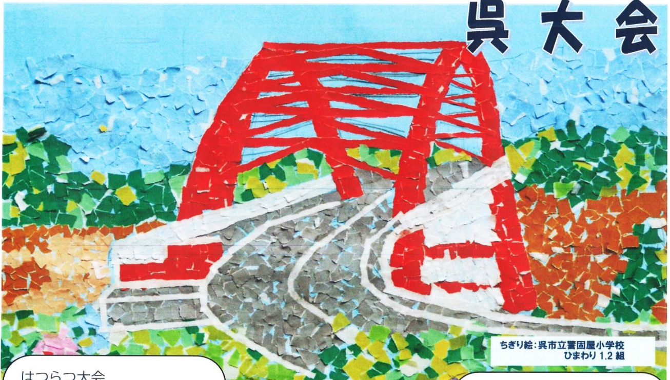
ちぎり絵:呉市立誓園屋小学校 ひまわり1.2組