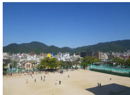
和庄小学校から見た呉の町

わたしたちの和庄小学校は、呉の東側にある休山の麓にあります。校舎の2階にある「なかよし広場」からは呉の町の様子が海から灰ヶ峰まで見えます。春は桜の花、秋は真っ赤な夕日がとてもきれいです。和庄の谷を休山に向かって登っていくと、住宅地を過ぎて山道に入る辺りに源宗坊寺というすごいお寺があります。この夏にあ