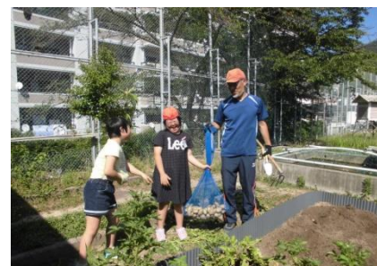
ジャガイモがいっぱい採れた

あおぞら学級では、年間を通して学級園で栽培活動をしています。収穫した物をいろいろな方法でみんなで調理して食べたり、他の人にも食べてもらったりしました。今年の夏にとれた作物は、ジャガイモ、イチゴ、キュウリ、トマト、スイカ、メロンなどです。特に、ジャガイモは去年の失敗をもとに土づくりから取り組んで今年