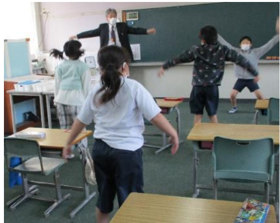
ラジオ体操をしています。しっかり手をのばしています。