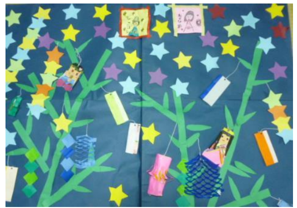
七夕飾りをみんなで作りました。すてきな掲示ができました。