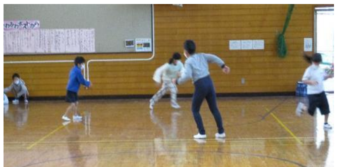
「氷鬼ごっこ」は、みんな大すきで、楽しく体を動かしています。