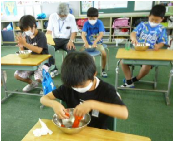
スライムをつくりました。手ざわりが気持ちよかったです。

警固屋小学校のひまわり学級には、1年生2名、3年生1名、4年生3名、たんぽぽ学級には3年生1名、コスモス学級には、1年生1名が在籍しています。お互い協力しながら、毎日がんばっています。毎週火曜日に3つの学級が集まり、ラジオ体操やスライムづくり、氷鬼ごっこをしたり作品をつくったりいっしょに仲良く活動しています。