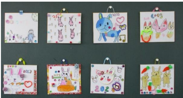
うさぎ年のしきしをそれぞれが工夫して作りました。かわいいうさぎができました。