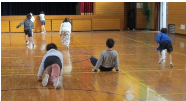
「だるまさんがころんだ」を広い体育館でのびのびとしています。