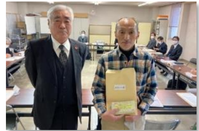
呉本庄つくし園の園長先生と