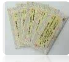
記念品贈呈式 を行いました。

(今年度もコロナ感染予防のため、呉市立中学校特別支援学級卒業激励会は開催することができませんでした。)