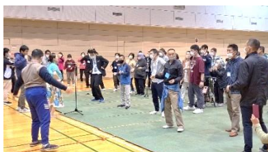
昨年度のレクリエーションの様子