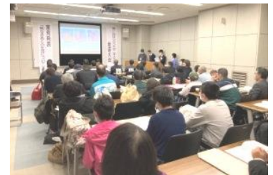
昨年度の行政との話し合いの様子